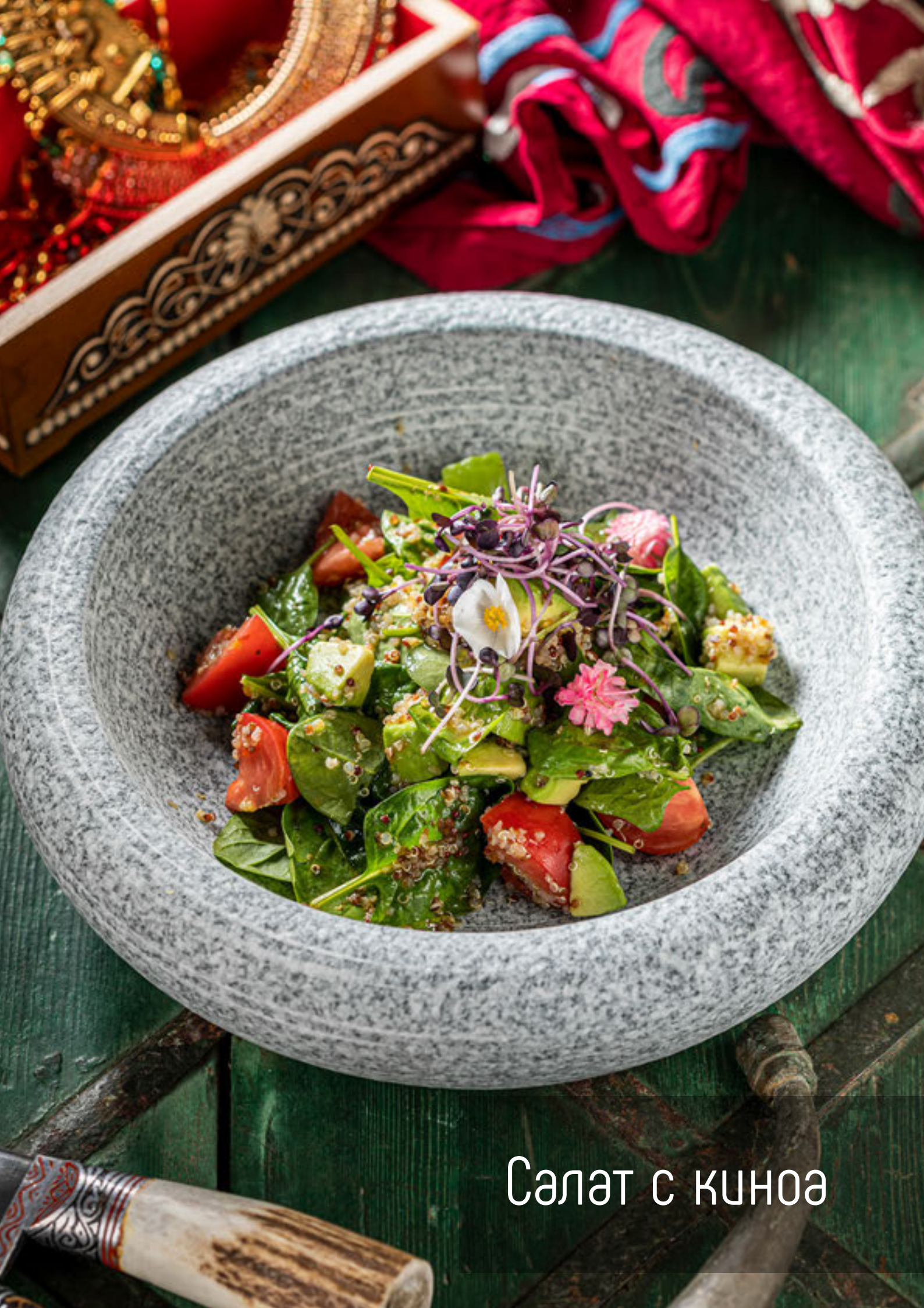
Салат с киноа