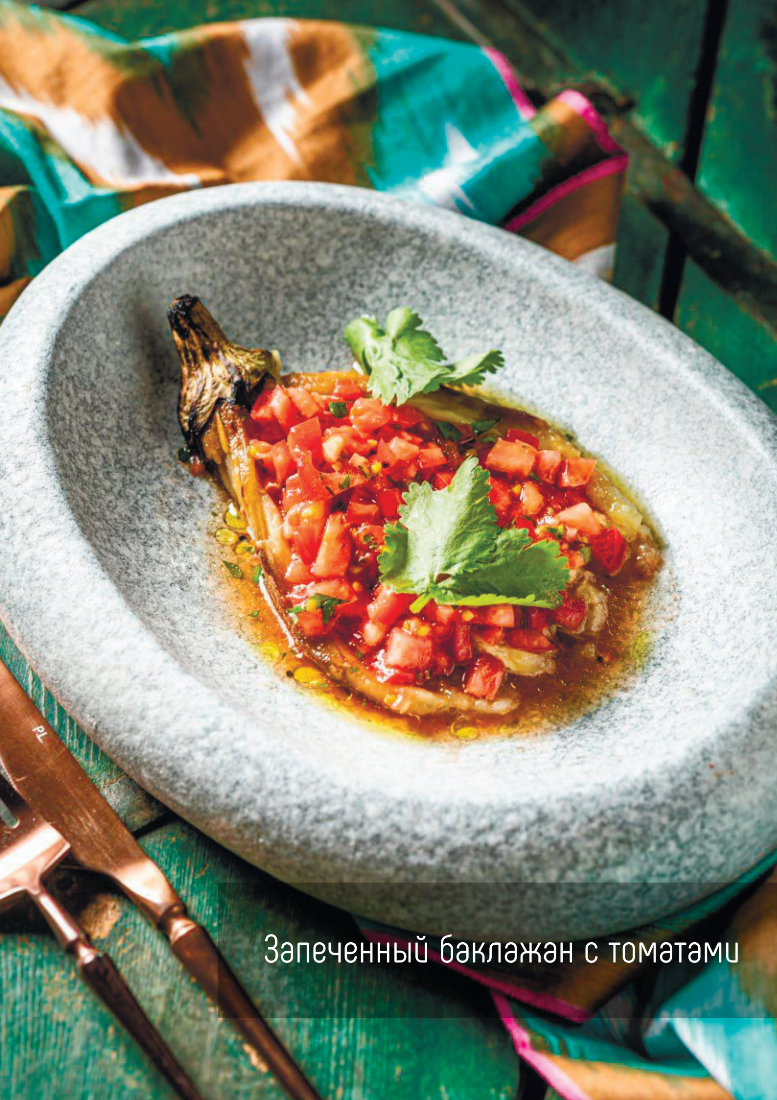
Запеченный баклажан с томатами